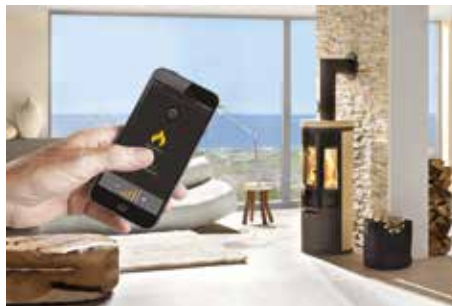
MODUS 100 - 120