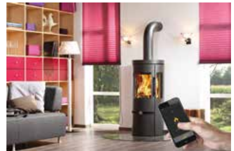
NURO 100 - 120